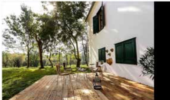
VILLABOGART Vendégház és Fesztiválpályáival

Ha eddig nem jövat mondott nektek az a név, hogy Alsóbogát, akkor ezután fog. Itt található ugyanis egy nagyon szép meseteli hely, a Villa Bogart Vendégház. A vendégház pedig csupán egy potty a 17 hektáros Festetics-Inkey kastélyparkban, melyre számtalan elküldött lámpa is hűsöl, kertészek, romos kastély, hangár és veterán kocsijárás lepi meg a bejáróló nézőlődöt. Errele vadregényes táj park a társul, it nem lehet megépődni azon, ha valamilyen meseteli lény kilep a fák mögöl.